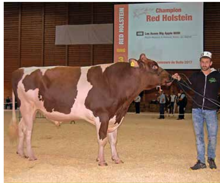
Les Asses Big Apple Bobi, champion Red Holstein. M. CURRAT

Le volume des ventes a augmenté de 7% par rapport à l'édition 2016. Le prix moyen, toutes races confondues se situe à 3033 francs avec une fourchette de prix s'échelonnant entre 2000 et 4000 francs. A noter qu'un tiers des animaux a trouvé preneur hors des frontières cantonales fribourgeoises.