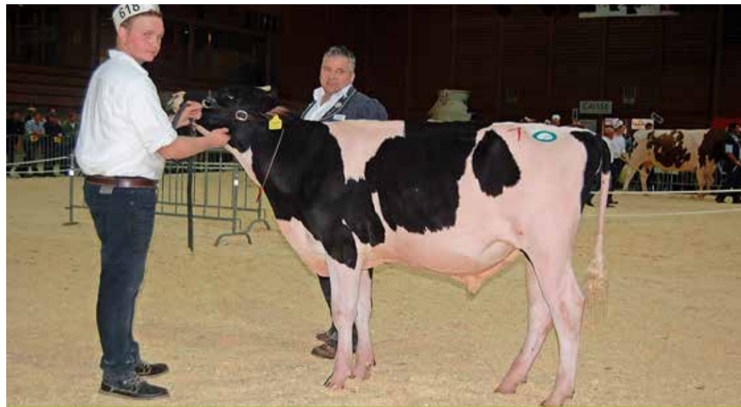
Les Ponts Elvis, champion Holstein et champion suprême (désigné par le public).