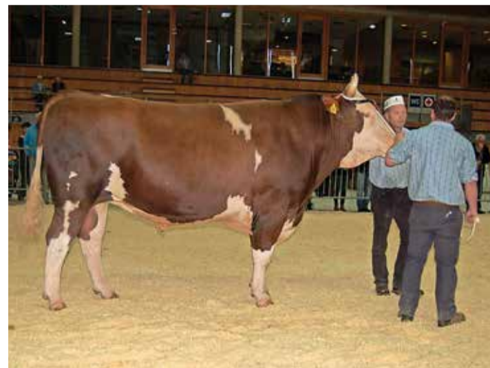
Ombre, champion Swiss Fleckvieh. M. CURRAT