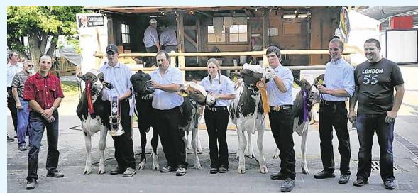
Les jeunes éleveurs vaudois au Comptoir suisse.