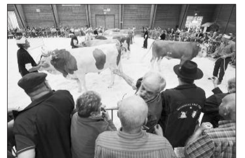
Près de 5000 visiteurs sont venus admirer les taureaux du Marché-concours ce week-end à Espace Gruyère.